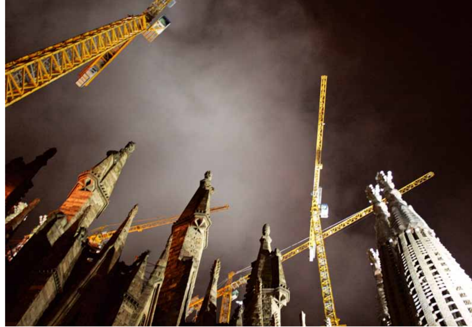
Die Baustelle der von Gaudí entworfenen Kirche La Sagrada Família in Barcelona

IM BUCH DER Offenbarung werden die Gebete der Ewigkeit als Rauchwerk beschrieben, dessen Duft zum Thron Gottes aufsteigt. Das ist eine Erkenntnis, die uns helfen kann, zu verstehen, welche Rolle unsere unbeantworteten Gebete am Ende in der Erfüllung von Gottes Epos spielen. In Offenbarung 5 sieht Johannes das Lamm, das geschlachtet ist, vor dem Thron